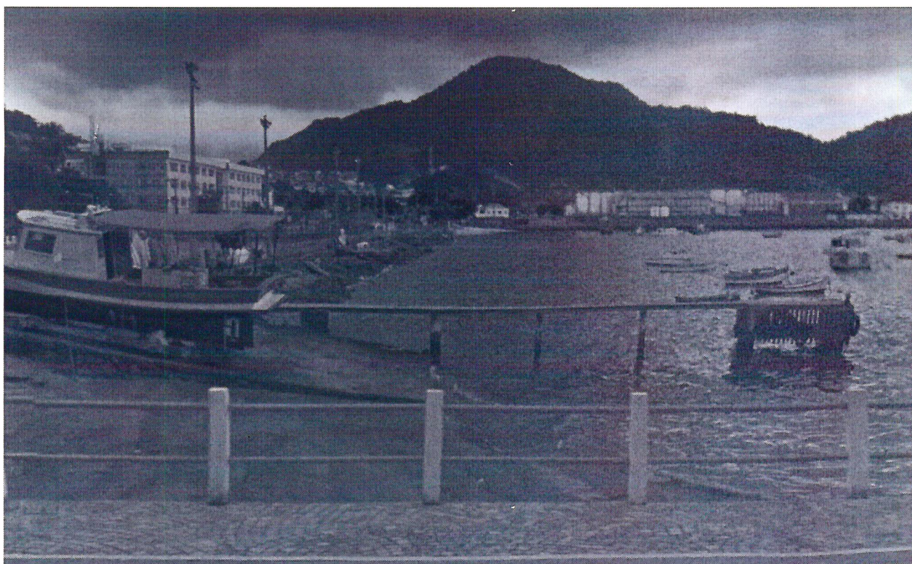
Angra dos Reis, em 12 de Outubro de 2018

A referida indicação se faz necessária, pois a falta de iluminação poderá ocasionar insegurança aos barqueiros e suas pequenas embarcações.