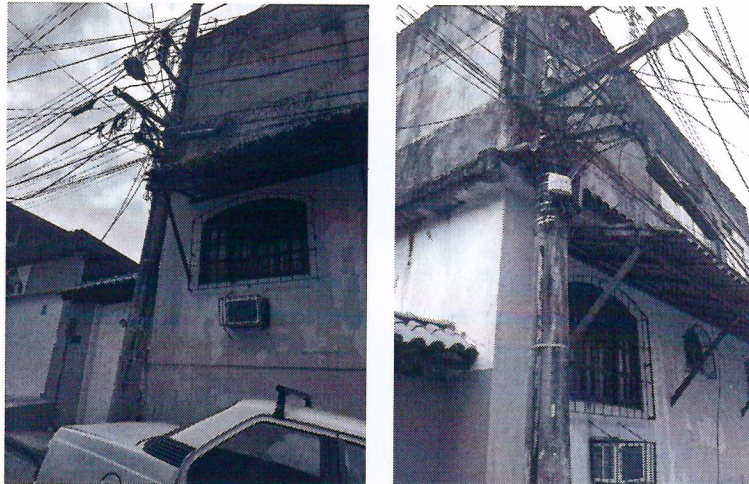
Angra dos Reis, em 27 de março de 2018.

O poste está muito próximo a residência, fazendo com que a fiação passe próximo a casa dos moradores, trazendo riscos de acidentes.